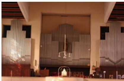
Prospectus après 1947

K O N T R A C H T S L A S : ***** Für die Kirchenfabrik von Herra-Jean, S.S.S./Gronne. Inbezug über Statuen der noch fehlenden Register, sowie Vervollständigung des Prospektes der Orgel in der Pfarrkirche von S.S.S./Herra-Jean. In Übereinstimmung mit dem Auftr. d. d. S. S. S. / G. Herra-Jean. S.S.S./Herra-Jean. ***** Z U S A M M E N F A S S U N G : I Manual: 1 Register Rechtsseite 4' II Manual: 1 Register Von Oktavseite 8' III Manual: 1 Register Linksseite 8' Pedal: 1 Register Quintessenz 10 2/3'