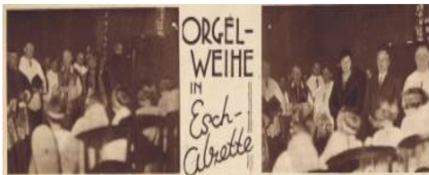
Die Geistlichkeit betritt die Kirche

Dritter Sonntag im Advent. Feierliche Einsegnung der neuen Orgel. 10 Uhr. Feierlicher Empfang des Hochwürdigsten Herrn Bischofs am Eingang der Kirche. Ansprache Hochdesselben, Einsegnung der Orgel und feierliches Hochamt für alle Wohltäter der Kirche, Nachmittags (keine Vesper) UM ½ 4 Uhr großes Orgelkonzert, zu welchem alle Gläubigen herzlichst eingeladen sind.