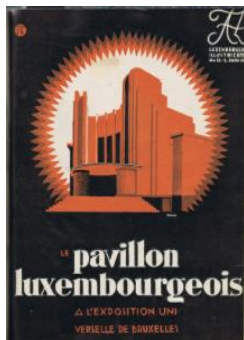
Photo du périodique „LUXEMBURGER ILLUSTRIRTE AZ“ N° 22 du 2 juin 1935 mise à disposition par Dan CAO